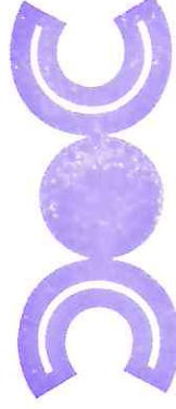
CENTRO DE CONCILIACIÓN LABORAL DEL ESTADO DE TLAXCALA