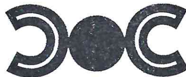
CENTRO DE CONCILIACION LABORAL DEL ESTADO DE TLAXCALA

ÚLTIMA HOJA DEL ACTA DE LA QUINTA SESIÓN ORDINARIA DEL COMITÉ DE TRANSPARENCIA DEL ORGANISMO PÚBLICO DESCENTRALIZADO, DENOMINADO “CENTRO DE CONCILIACIÓN LABORAL DEL ESTADO DE TLAXCALA”, CELEBRADA EL DÍA JUEVES VEINTITRÉS DE JUNIO DE DOS MIL VEINTIDÓS.